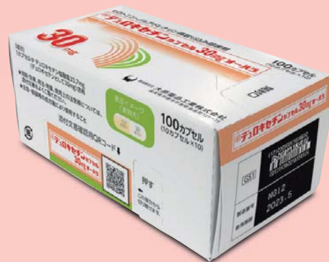
デュロキセチンカプセル30mg「オーハラ」