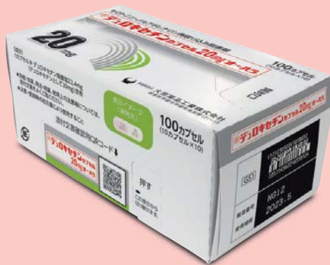
デュロキセチンカプセル20mg「オーハラ」